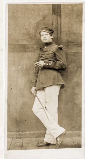
Bildzitat 3 (rechts): Enno Kaufhold: Heinrich Zille – Photograph der Moderne, München 1995, Tafel 1.

https://heinrich-zille.info/ , Stand Januar 2023.